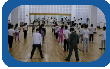
LANSARE ALPHA KARATE CLUB