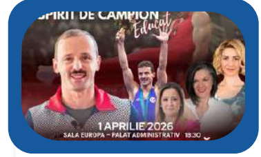
INCUNUNAREA A SAPTEA EDITII "SPIRIT DE CAMPION EDUCAT"